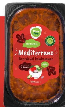
Spread & dip MEDITERRANO