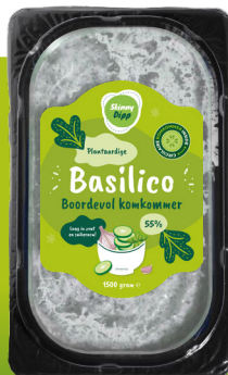
Spread & dip BASILICO