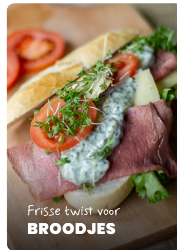
Frisse twist voor BROODJES