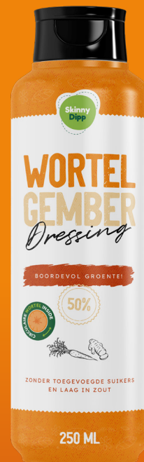
Dressing WORTEL GEMBER

Alle dressings zijn verkrijgbaar in 250ml en 775ml verpakkingen.