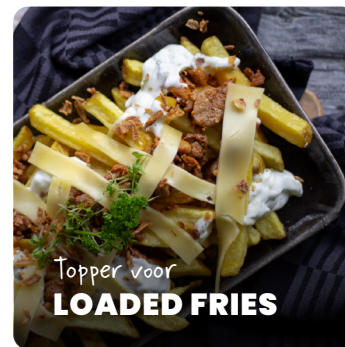
Topper voor LOADED FRIES