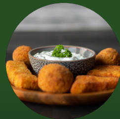
FRIPA PARTY MIX