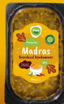
Spread & dip MADRAS

Alle dips zijn verkrijgbaar in 1,5kg en 4kg verpakkingen.