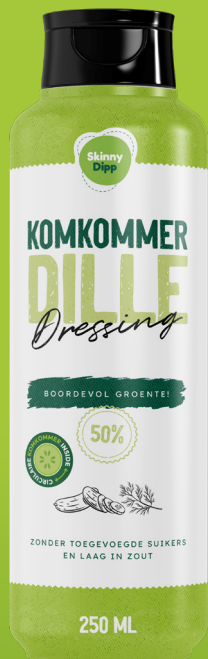
Dressing KOMKOMMER DILLE