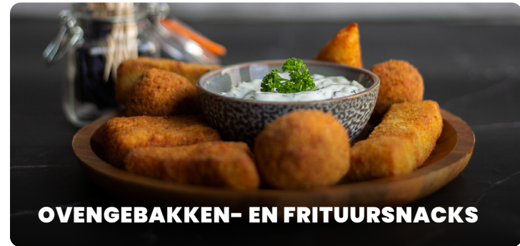
OVENGEBAKKEN- EN FRITUURSNACKS