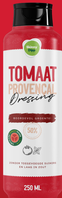
Dressing TOMAAT PROVENCAL