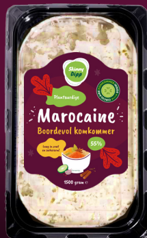
Spread & dip MAROCAINE