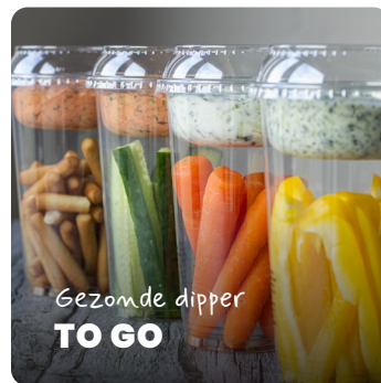
Gezonde dipper TO GO