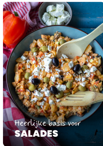
Heerlijke basis voor SALADES