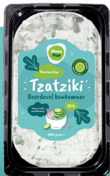
Spread & dip TZATZIKI